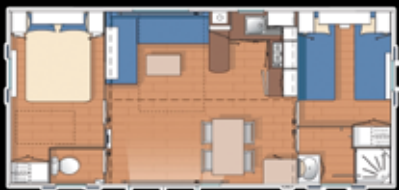
TYPE 2 2 Chambres 4/6 personnes