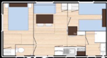
TYPE 1 2 Chambres 4/6 personnes