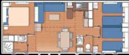
TYPE 4 3 chambres 6/8 personnes