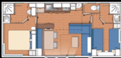
TYPE 3 2 Chambres 2 salles de bains 4/6 personnes